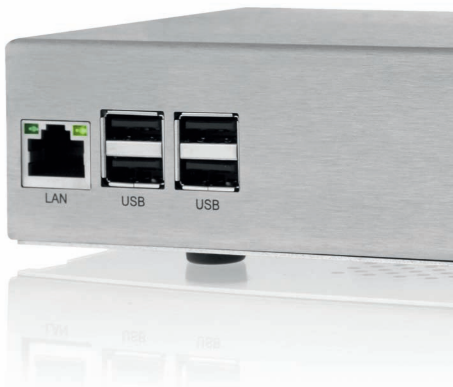
tiptel 8010 All-IP Appliance im hochwertigen Edelstahlgehäuse

Die zukunftssicheren Telefonanlagen aus deutscher Entwicklung bieten einen hohen Investitionsschutz. Sie ermöglichen flexible Erweiterungen einfach und effizient über entsprechende zusätzliche Lizenzen und verfügen über umfangreiche Kompatibilität mit den aktuellen VoIP-Providern und -Produkten. So sind die Anlagen schon heute mit dem Deutschland-LAN SIP-Trunk im neuen zukunftsweisenden All-IP-Netz der Deutschen Telekom AG (BNG) kompatibel.