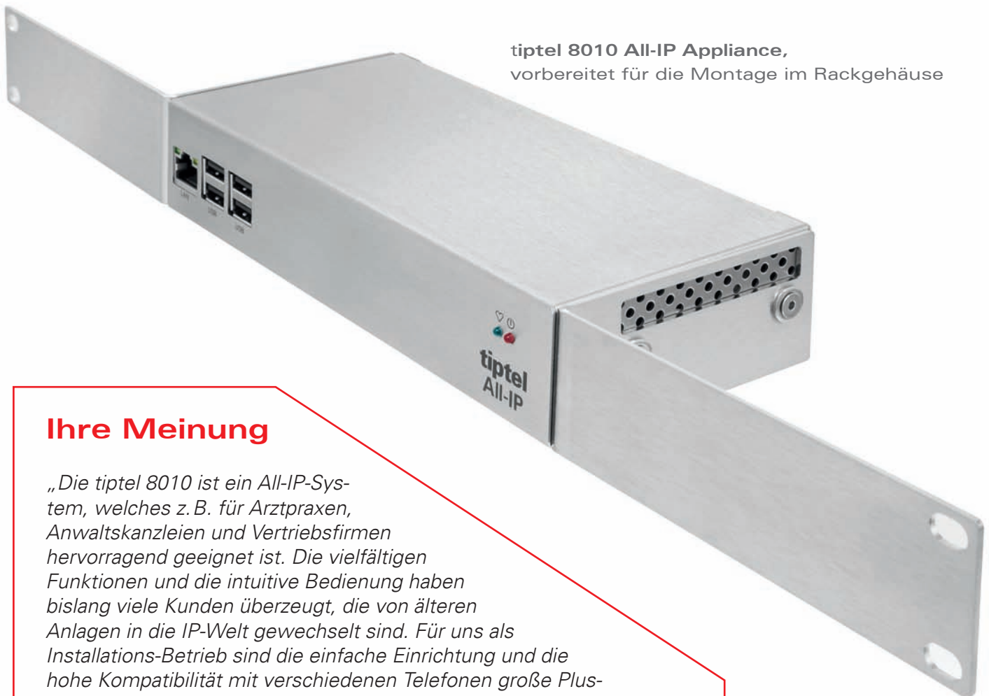
tiptel 8010 All-IP Appliance, vorbereitet für die Montage im Rackgehäuse

Als Software-Version steht neben der tiptel 8010 All-IP auch die größere Variante tiptel 8020 All-IP für Microsoft Windows, Apple Mac OS X und Debian Linux zur Verfügung. Beide können auf einem PC, Server oder in einer virtuellen Maschine im eigenen Netzwerk betrieben werden.